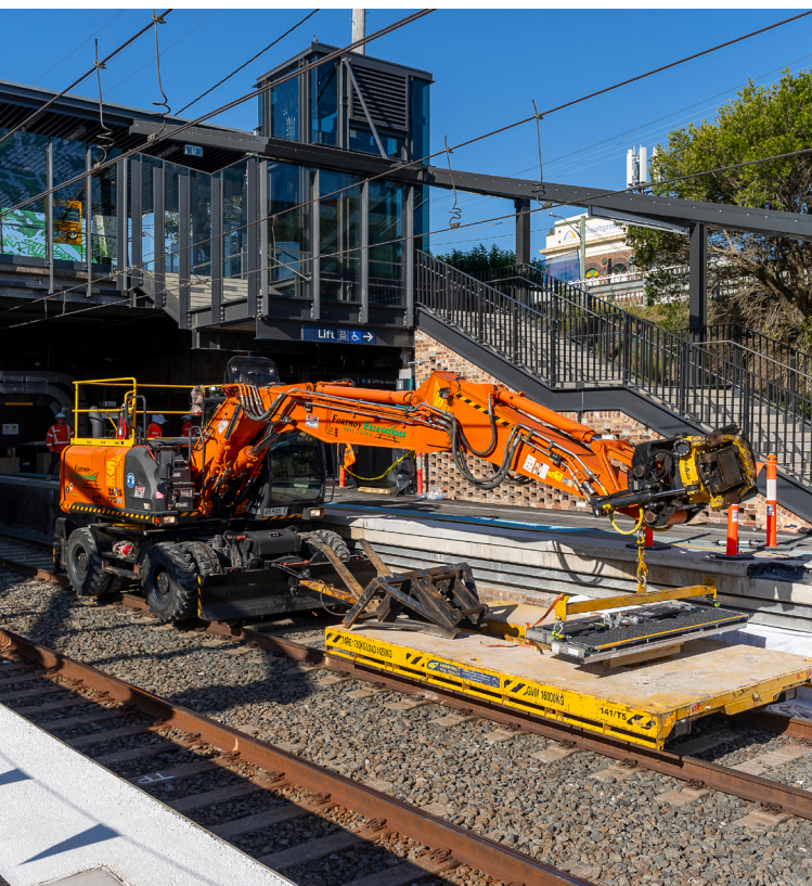
上圖：位於 Hurlstone Park 的悉尼地鐵改建施工現場

悉尼地鐵 (Sydney Metro) 將提供即到即走的服務，尖峰時段每四分鐘運行一班列車，即每小時15班。在早高峰三小時內，悉尼地鐵在 Bankstown 至悉尼市中心之間的運力可達每個方向51,000人，較現在增加15,000人。