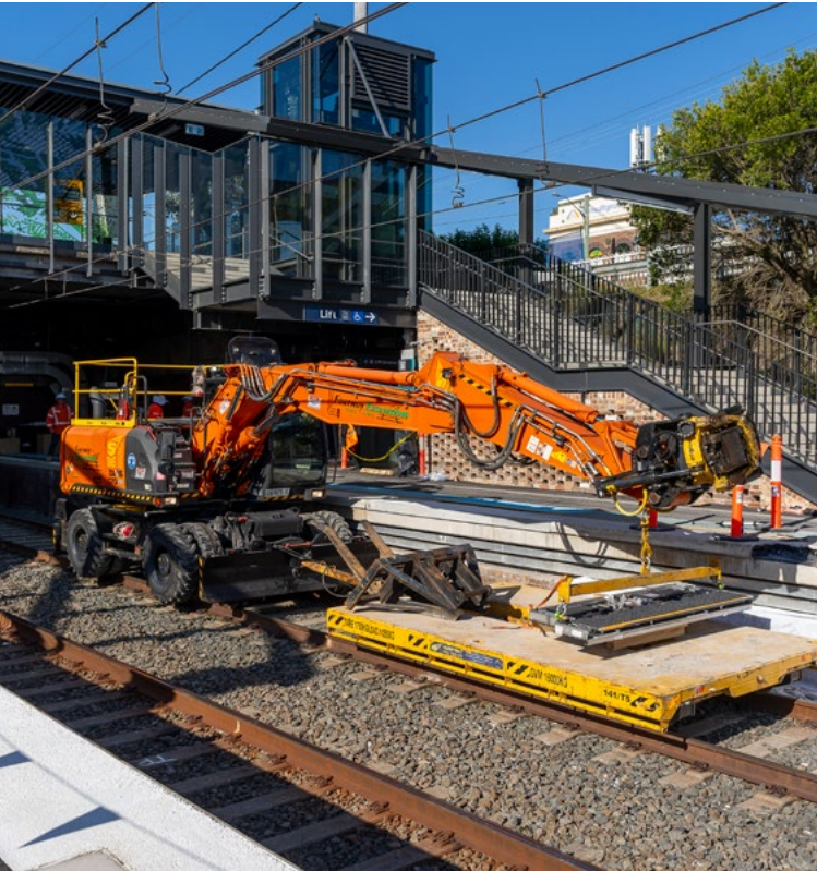
اوپر: Hurlstone Park میں سڈنی میٹرو کی تعمیر کا کام

سڈنی میٹرو سروس میں مسافر سٹیشن پر پہنچنے کے ساتھ ہی سفر شروع کر سکیں گے کیونکہ مصروف ترین اوقات میں ٹرینیں ہر چار منٹ بعد چلیں گی - یعنی ہر گھنٹے میں 15 ٹرینیں۔ صبح کے تین مصروف ترین گھنٹوں میں سڈنی میٹرو سروسز Bankstown اور Sydney CBD کے درمیان دونوں سمتوں میں 51,000 مسافروں کو پہنچائیں گی - جو مسافروں کی موجودہ تعداد میں 15,000 کا اضافہ ہے۔