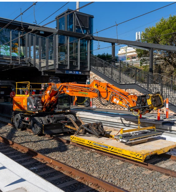
上圖：位於 Hurlstone Park 的悉尼地鐵改建施工現場

悉尼地鐵 (Sydney Metro) 將提供即到即走的服務，尖峰時段每四分鐘運行一班列車，即每小時15班。在早高峰三小時內，悉尼地鐵在 Bankstown 至悉尼市中心之間的運力可達每個方向51,000人，較現在增加15,000人。